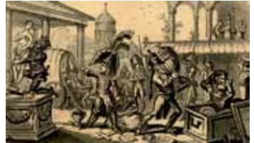
Seizing the italian relics

« Certes, si nos armées victorieuses pénétrèrent en Italie, l'enlèvement de l'Apollon du Belvédère et de l'Hercule Farnèse serait la plus brillante conquête. C'est la Grèce qui a décoré Rome ; mais les chefs-d'œuvre des républiques grecques doivent-ils décorer le pays des esclaves ? La République française devrait être leur dernier domicile ».