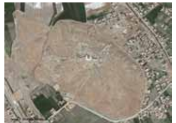
Site archéologique de Mari après pillage

Si elle produit une nouvelle archive par la voie d'une documentation la plus précise possible, l'original disparaît. La constitution de cette archive de la recherche est donc primordiale. Un site archéologique pillé est une archive de l'histoire, unique, brûlée à jamais avant d'avoir été lue. Au Moyen-Orient, les sites archéologiques se comptent par milliers. Chacun renferme des pages d'histoire inédites relatives aux origines de nos civilisations. Les éventrer prive le monde de son histoire et les « beaux objets », revendus, deviennent autant d'œuvres d'art sans signification.