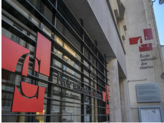
Façade de l'École nationale des chartes

Le DUSA a été créé par trois institutions partenaires dans le cadre d'actions de développement en faveur de l'Enseignement supérieur en Afrique soutenues, en France, par le Ministère de l'Europe et des Affaires étrangères. Les trois partenaires ont mis en commun leur expertise, reconnue au niveau international, afin de co-accréditer le DUSA.