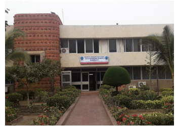
Façade de l'École de Bibliothécaires, Archivistes et Documentalistes (EBAD)

L'École de Bibliothécaires, Archivistes et Documentalistes (EBAD) est un institut de l'Université Cheikh Anta Diop de Dakar créé en 1967 avec le concours de l'UNESCO. Elle se consacre aux activités d'enseignement et de recherche dans le domaine des sciences de l'information documentaire, en développant des formations multiples, du niveau licence jusqu'au doctorat, tant au Sénégal qu'à l'étranger grâce aux nombreuses actions de coopération internationale auxquelles elle participe.